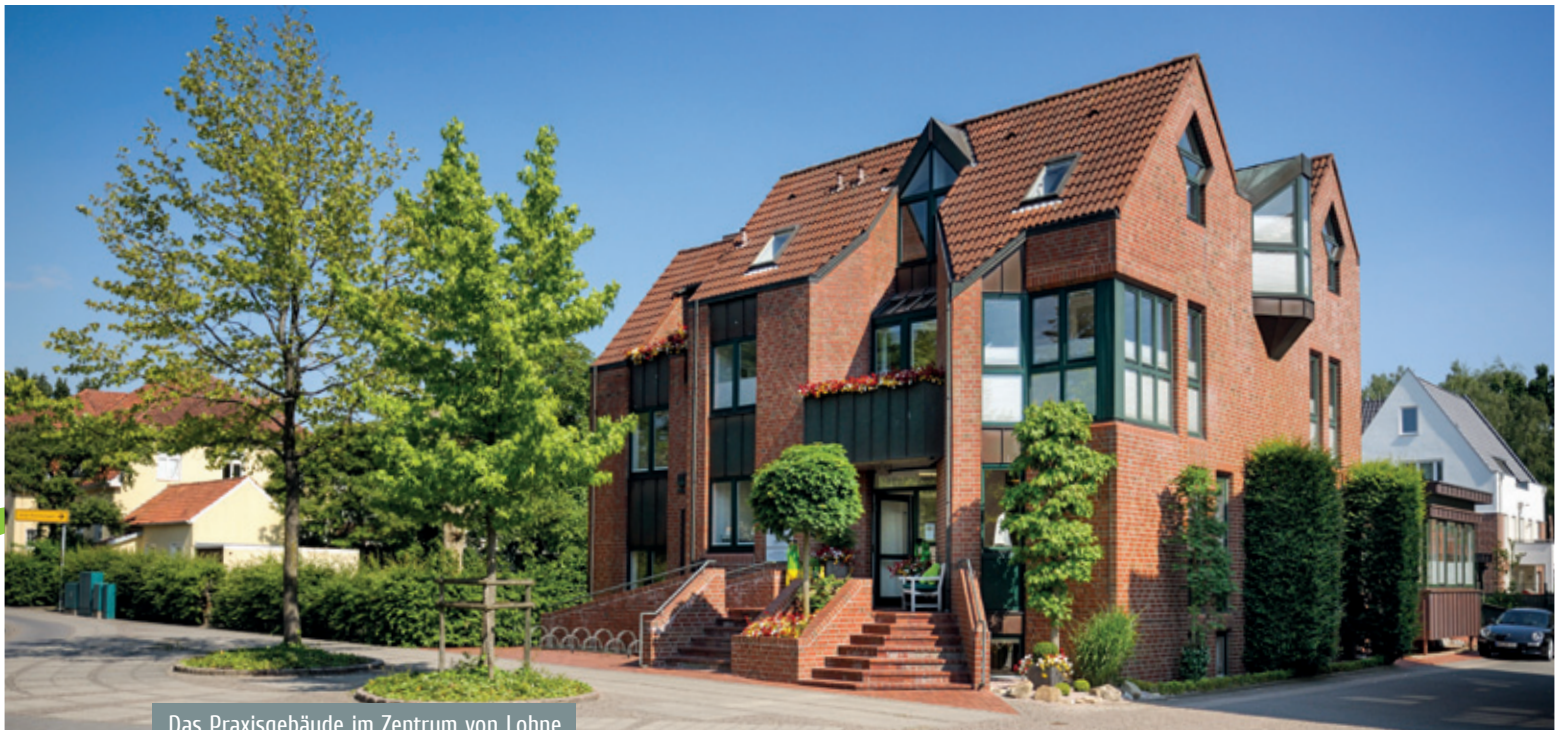
Das Praxisgebäude im Zentrum von Lohne